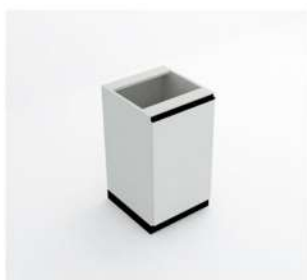
MÓDULO C/ 1 PORTA PEQUENO