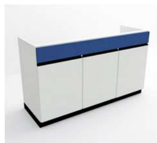
MÓDULO PIA GRANDE 3 e 4 PORTAS

10070 - MP80P2 10071 - MP90P2 10072 - MP100P2 10073 - MP110P2 10074 - MP120P2