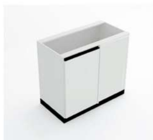
MÓDULO ESQUERDO DE CANTO

10083 - MD90P1 10084 - MD100P1 10085 - MD110P1