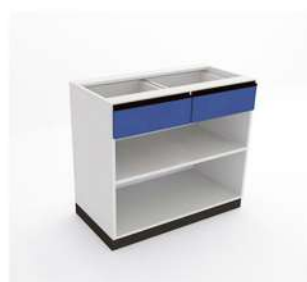
MÓDULO ABERTO GRANDE COM 2 GAVETAS