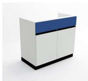
MÓDULO PIA 2 PORTAS

10066 - ML40 10067 - ML45 10068 - ML50 10069 - ML60