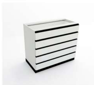
MÓDULO GAVETEIRO GRANDE 5 GAVETAS

10041 - M40G5 10042 - M45G5 10043 - M50G5 10044 - M60G5 10045 - M70G5