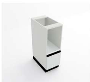
MÓDULO CPU COM GAVETA

10075 - MP140P3 10076 - MP150P3 10077 - MP160P3 10078 - MP180P4 10079 - MP200P4