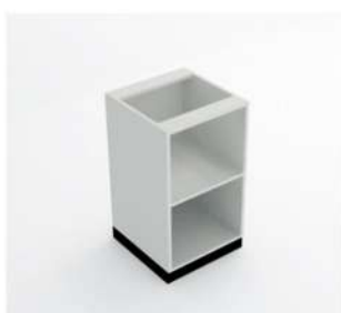
MÓDULO ABERTO TIPO NICHÔ

FABRICADOS NAS MEDIDAS PADRÃO OU PERSONALIZADO.