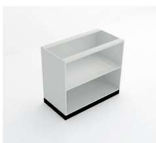
MÓDULO ABERTO GRANDE