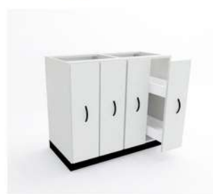
MÓDULO P/ REAGENTE COM 4 GAVETAS

10051 - M40RG1 10052 - M45RG1 10053 - M50RG2 10054 - M60RG2 10055 - M70RG2