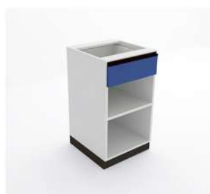
MÓDULO ABERTO COM GAVETA