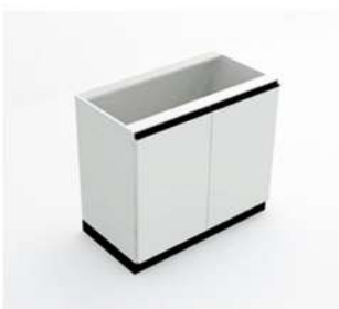
MÓDULO C/ 2 PORTAS GRANDE