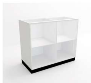
MÓDULO NICH GRANDE

10086 - ME90P1 10087 - ME100P1 10088 - ME110P1