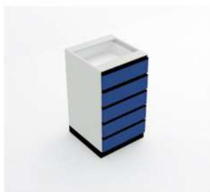
MÓDULO GAVETEIRO 5 GAVETAS

10041 - M40G5 10042 - M45G5 10043 - M50G5 10044 - M60G5 10045 - M70G5