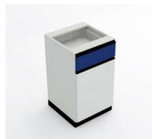
MÓDULO PORTA E GAVETA PEQUENO