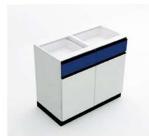
MÓDULO PORTA E GAVETA GRANDE