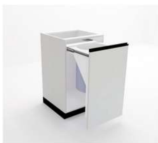
MÓDULO LIXEIRA COM CESTO PVC

10061 - M40G3PS 10062 - M45G3PS 10063 - M50G3PS 10064 - M60G3PS 10065 - M70G3PS