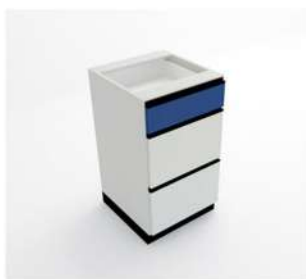
MÓDULO GAVETA PARA PASTAS SUSPENSAS

10056 - M80RG2 10057 - M90RG3 10058 - M100RG4 10059 - M110RG4 10060 - M120RG4