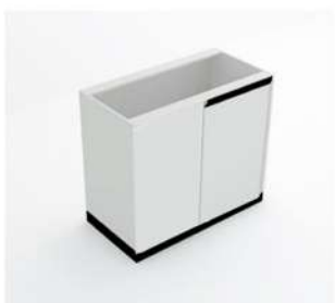
MÓDULO DIREITO DE CANTO

10080 - MCPU30G1 10081 - MCPU40G1 10082 - MCPU50G1