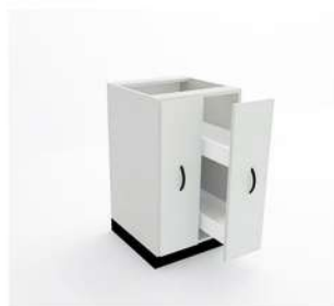
MÓDULO P/ REAGENTE COM 2 GAVETA

10046 - M80G5 10047 - M90G5 10048 - M100G5 10049 - M110G5 10050 - M120G5